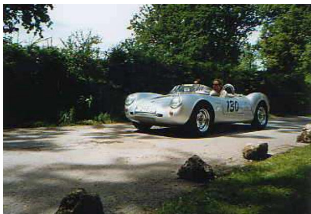
Ob der echt ist? Porsche 550 Bergspyder