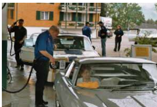
...da freut sich der Tankwart... Tankstop im Bregerner Wald