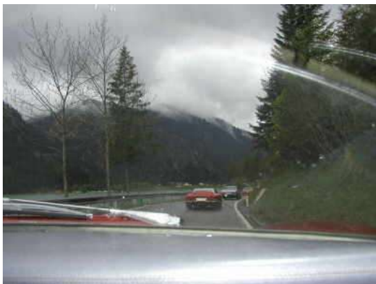
Trübe Suppe: der Plansee, realistisch betrachtet Marianne verdanken wir diesen Blick aus dem Grifo CanAm

Die Tour am nächsten Tag mußte ich wegen des schlechten Wetters umplanen: das Hahntennjoch mit über 1.800 m ließen wir aus und fuhren stattdessen über Oberjoch und Gaichtpass zum Schloß Linderhof.